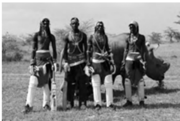
Massai players in kits