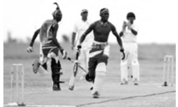
Massai batsmen building a partnership