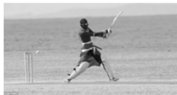
Massai Captain, Nissan Ole Meshami

The sun rose between the hills near the Great Rift Valley in Kenya. The wild buffaloes had their morning grazing routine over the dry grass that extended towards the dry riverbed. The birds flew through the hot winds in search of water while, some of them sat on the wild buffaloes to feed on the insects troubling the buffaloes. The elephants marched down the dry, barren lands in search of the lush green grass near the riverbeds. Yes, this seems to be a regular scene from a documentary movie on African wildlife, until a cricket ball hit from an English willow rolled over the dry grass for a boundary! Nissan Jonathan Ole Meshami, the Massai tribesman, had hit, a cover drive sighting a gap between the opposing fielders thus fetching a victory for his team. Playing in their traditional colorful outfits, the Massai Warriors had just won a practice match against their fellow tribesmen! In between the celebrating tribesmen, the little young girl, Eunice, jumped happily, with deep gratitude towards the game of cricket!